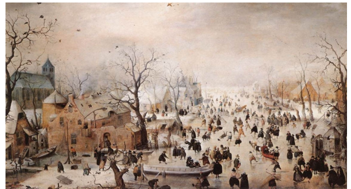
"Paysage d'hiver : les patineurs" 1608 par Hendrick AVERKAMP